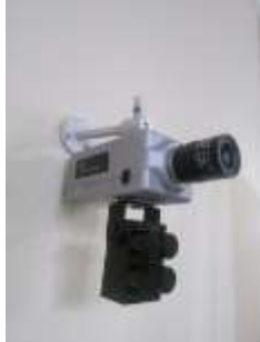
Kamera altına montaj