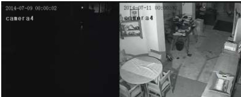
"micro indoor" 90°, off ve on